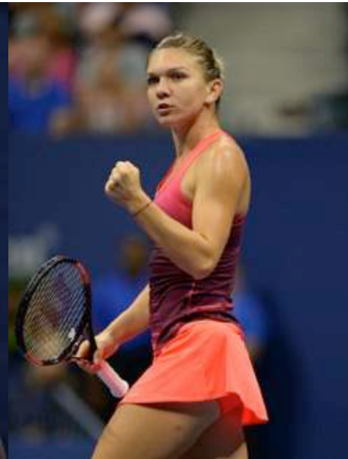
S.HALEP N° 4 Mondiale