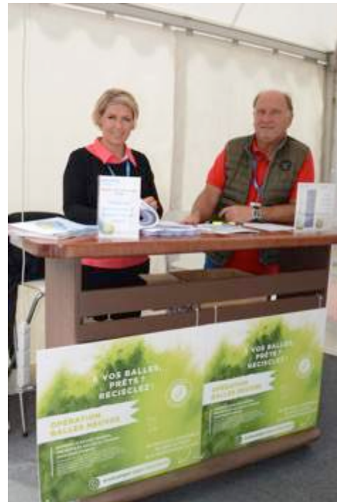
SIGNALÉTIQUE RECYCLAGE DÉCHETS ET AUX ÉCO-GESTES