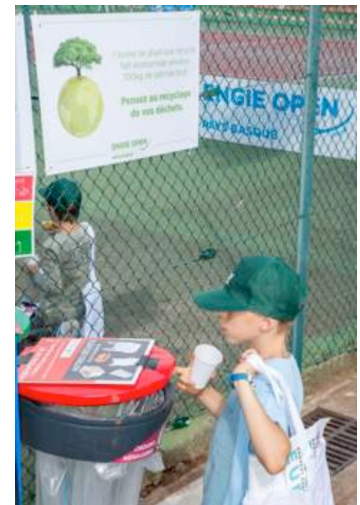
POUBELLES DE TRI SUR L'ENSEMBLE DU SITE DU TOURNOI