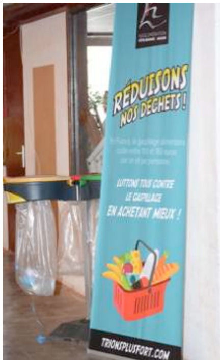
ACBA : SENSIBILISATION AU TRI DES DÉCHETS